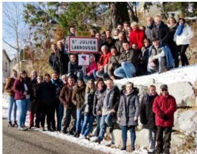
Photo souvenir avant le départ

Nous leur souhaitons bonne route et bonne chance pour la suite de leurs aventures !